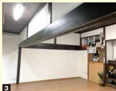
客間からLDKに 1 間仕切りとなっていた物入を解体し、広々としたリビング・ダイニングに。掃き出し窓からの眺めは絶景 2 3 趣のある神棚と下がり壁は以前のまま