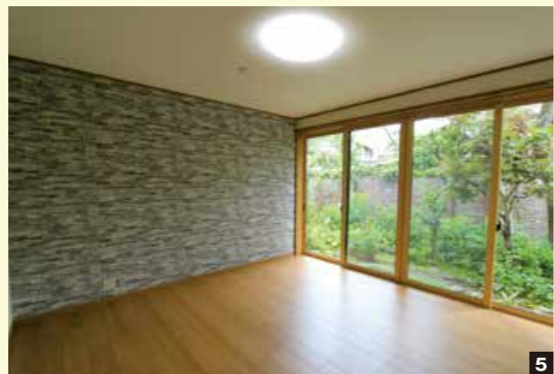
2箇所の寝室 4 5 アクセントクロスを採用し、各部屋異なる雰囲気を楽しめます 念願のサンルーム 6 室内干しに最適なサンルーム。多目的に使用できるため、いろいろな過ごし方が楽しめます 全体を見渡せるキッチン 7 キッチンにはリビング・ダイニングを見渡せるように、向きを変えて